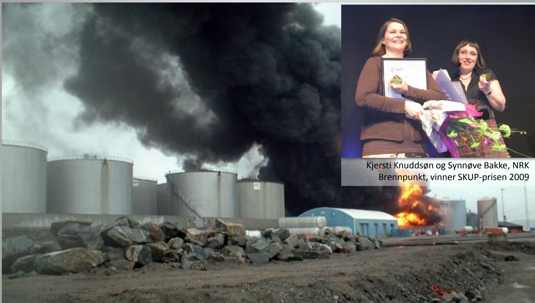
24. mai 2007 eksploderte en tank ved Vest Tanks anlegg i Sløvåg i Gulen.