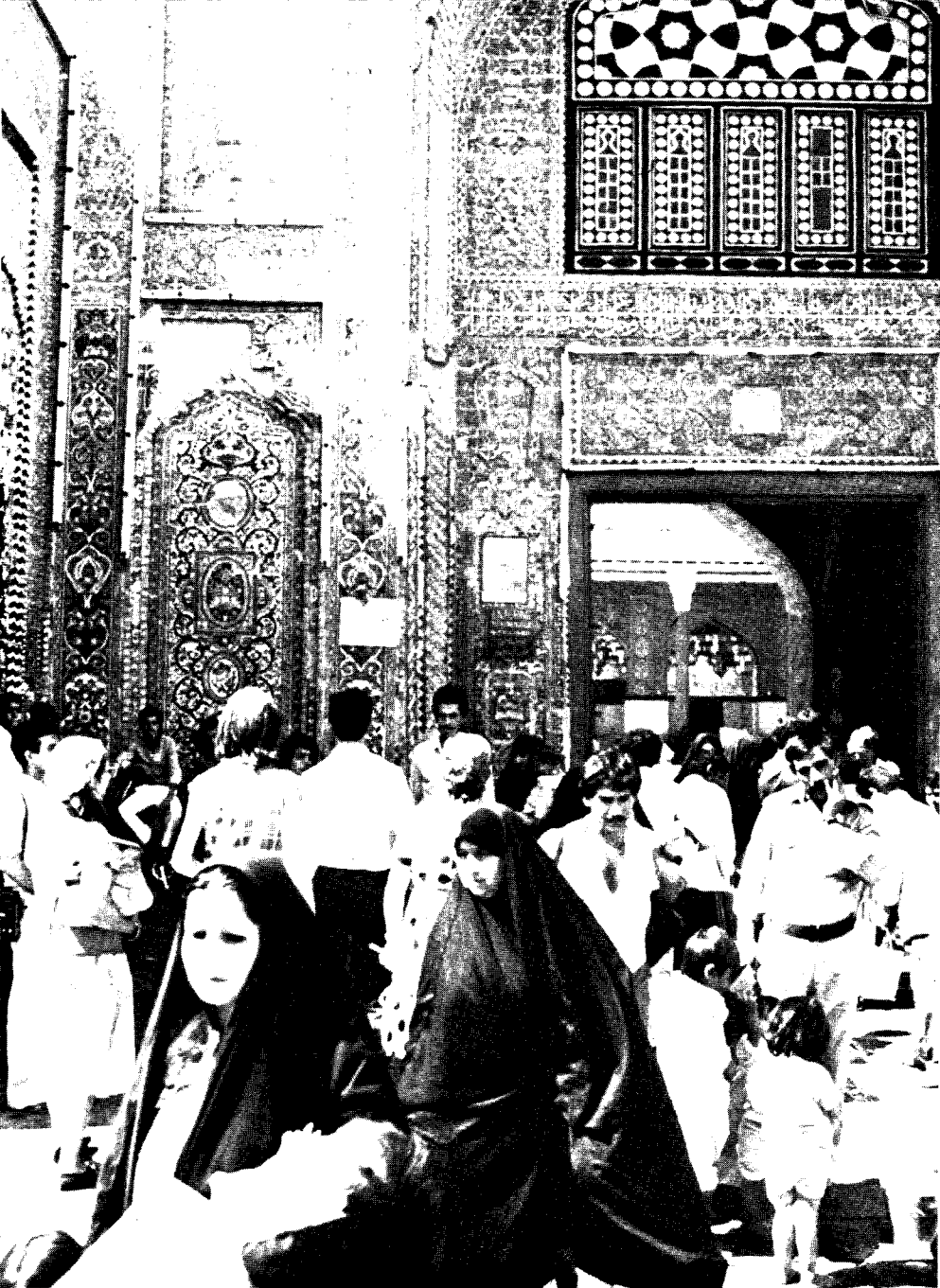
Khadimain-moskéen i Bagdad - en av de fire Shia-helligdommene i Irak. Moskéen ble oppført i AD 799 og inneholder gravene til de to Imam'er Musa og hans sønnesønn Mohammed Jawad.

undertrykt og tildels splittet. Tidligere hadde dette sammenheng med at shia-muslimene i Irak stort sett utgjorde et jordbruksproletariat, mens byeliten var sunni-muslimer. Britene innførte en «splitt-og-hersk» politikk mot shia-flertallet under mandatperioden 1920-32. Denne politikken ble videreført under kongedømmet frem til 1958. Politikken gikk ut på å oppnevne prominente, lokale shia-muslimer på landsbygda som Bagdad-myndighetenes representanter og gi dem landprivilegier. Dermed ble det skapt en klassemotsetning på landsbygda mellom landeiere og jordbruksproletariat, som begge var