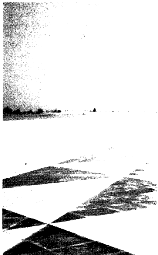
Martyr-monumentet i Bagdad.

Det er under henvisning til ovennevnte at den irakiske grenen av Baath-partiet legitimerer sitt styre. Baath-partiet i Irak har bare ca. 100 000 medlemmer og er ikke et masseparti, men et typisk kaderparti med kun aktive medlemmer. Alle prinsipielle politiske avgjørelser for samfunnsutviklingen blir tatt innen partiet. Alle medlemmer av Revolusjonsrådet er Baath-medlemmer, liksom alle de viktigste statsrådene. Partiet er representert gjennom hele statsapparatet, lokalforvaltningen, produksjonsliv, organisasjonsliv og yrkessammenslutninger i form av kaderceller som kun er ansvarlig overfor partiet. Bare Baath-partiet kan drive politisk virksomhet innen hæren og folkemilitsen. Baath-partiet er videre aktiv innen hele oppdragelses- og