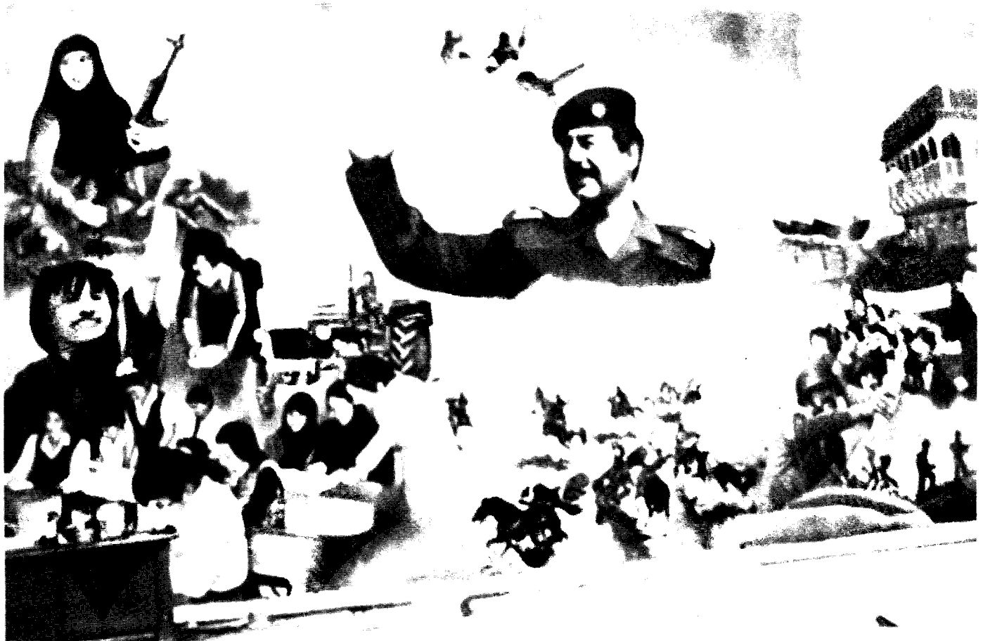
«Saddam's Qadisiyya» – politisk plakatmaleri fra Basrah ved Gulfen.

å ta over alle sentrale funksjoner. Og selv med kontroll over produksjonen i eget land, skulle oljen markedsføres og selges internasjonalt hvor oljeselskapenes dominans var fullstendig.